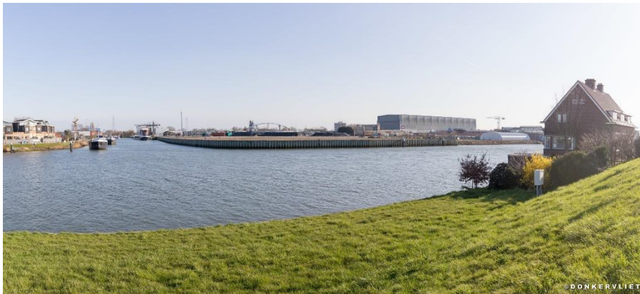
Zicht op de Stormpolderdijk vanaf Capelle aan den IJssel.

Het afgelopen half jaar heeft Richard Donkervliet, senior adviseur milieu bij Dura Vermeer en daarnaast fanatiek fotograaf, weer een aantal foto's gemaakt van de werkzaamheden op de Stormpolderdijk. Hieronder twee recente foto's. Op het fotoplatform Flickr staan alle foto's die hij tot nu toe heeft gemaakt.